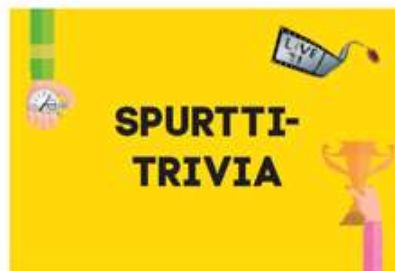
Spurttitrivia: 139€ sis. alv 24%