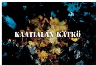
Kaatialan kätkö: 119€ sis. alv 24%