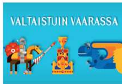
Valtaistuin Vaarassa: 139€ sis. alv 24%