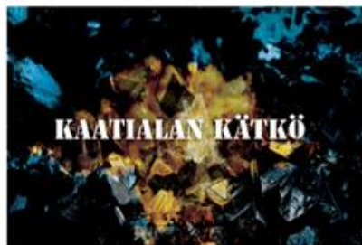
Kaatialan kätkö: 119€ sis. alv 24%