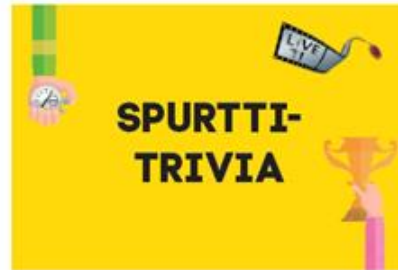
Spurttitrivia: 139€ sis. alv 24%