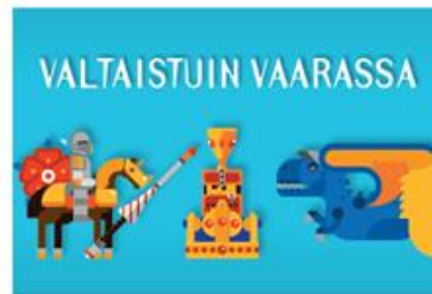
Valtaistuun Vaarassa: 139€ sis. alv 24%